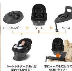
コンビ製チャイルドシート THE S エッグショック シリーズ

さらに詳しい製品の情報はコチラ▶ https://www.combi.co.jp/store/baby/carseat/thes_sp/