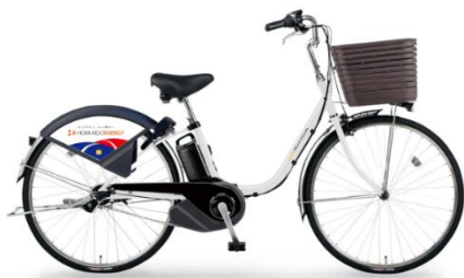
シティサイクル (35 台)

スポーツタイプ：30 分 300 円（延長 15 分 250 円）／12 時間 3,000 円