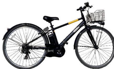
スポーツタイプ (15 台)

※ご利用車体/エリアによって料金に変更となる可能性がございます。ご利用前にご確認ください。